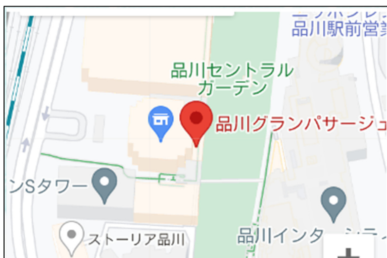
懇親会会場 アリスアクアガーデン品川 アクセスマップ ( https://www.r-alice.jp/shinjawa/ )